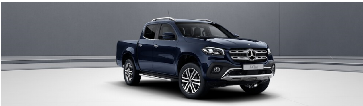
Lakier Błkitny kit cawansytu metalik